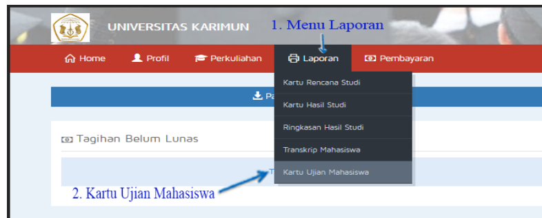
Gambar 1.1 Menu Cetak Kartu Ujian Mahasiswa